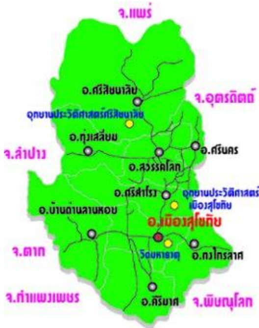
ภาพที่ ๒.๗ แผนที่การแบ่งเขตการปกครองจังหวัดสุโขทัย

ที่มา : ที่ทำการปกครองจังหวัดสุโขทัย, กันยายน ๒๕๕๖