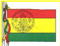
ภาพที่ ๒.๔ ธงประจำจังหวัดสุโขทัย