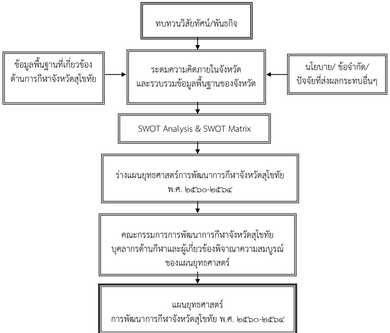
ภาพที่ ๑.๑ แผนภาพกระบวนการจัดทำแผนยุทธศาสตร์การพัฒนากีฬาจังหวัดสุโขทัย