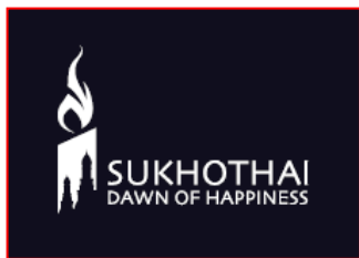
ภาพที่ ๒.๕ ตราสัญลักษณ์ด้านท่องเที่ยวจังหวัดสุโขทัย

ในการใช้ตราสัญลักษณ์สามารถใช้ได้ในรูปแบบที่หลากหลาย ขึ้นอยู่กับลักษณะการนำไปใช้ โดยสามารถปรับเปลี่ยนให้เหมาะสม เพื่อการสื่อสารที่ถูกต้องและชัดเจน